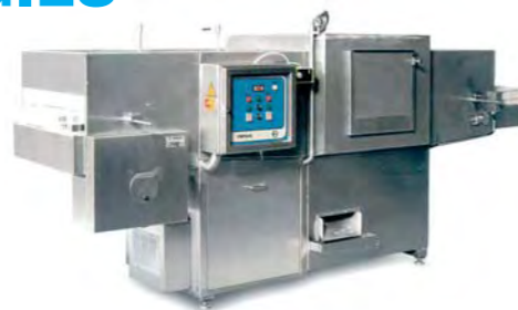
Tunnel de lavage