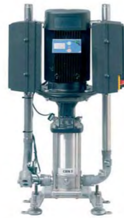
Station fixe de surpression