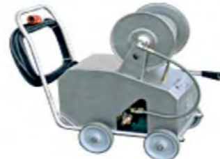
Centrale mobile HP et MP