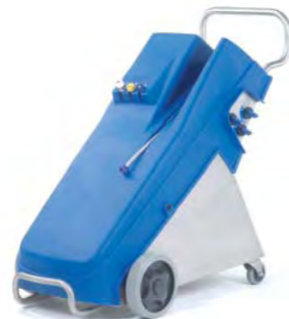
Centrale mobile MP