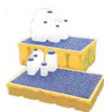
Bac de rétention